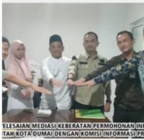
ELESAIAN MEDIASI KEBERATAN PERMOHONAN INF TAH KOTA DUMAI DENGAN KOMISI INFORMASI PRO