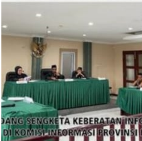
DANG SENGKETA KEBERATAN INFO DI KOMISI INFORMASI PROVINSI