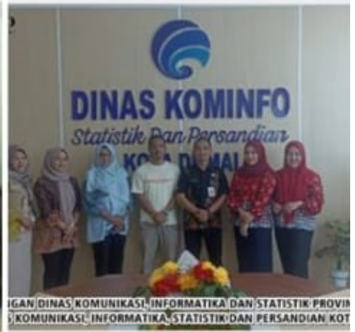
KEPADA DINAS KOMUNIKASI, INFORMATIKA DAN STATISTIK PROVINSI SULAWESI SELATAN DAN PERMINTAAN INFORMASI KE PPID, PEMERINTAH KOTA DUMAI