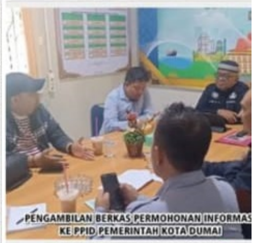
PENGAMBILAN BERKAS PERMOHONAN INFORMASI KE PPID, PEMERINTAH KOTA DUMAI