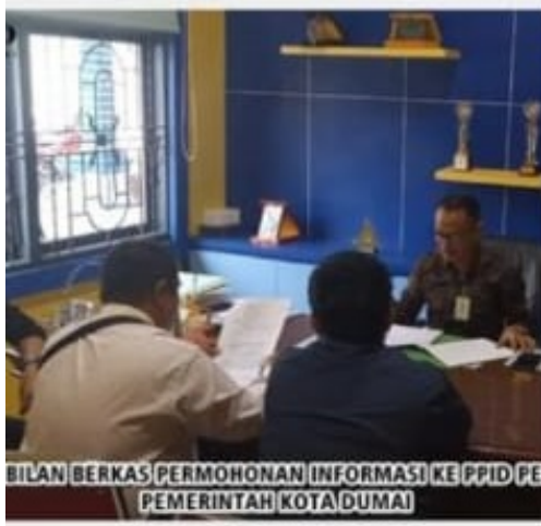
BILAN BERKAS PERMOHONAN INFORMASI KE PPID PE Pemerintah Kota Dumai