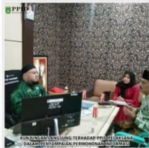
KUNJUNGAN LANGSUNG TERHADAP PPID PELAKSANA DALAM PENYAMPAIAN PERMOHONAN INFORMASI