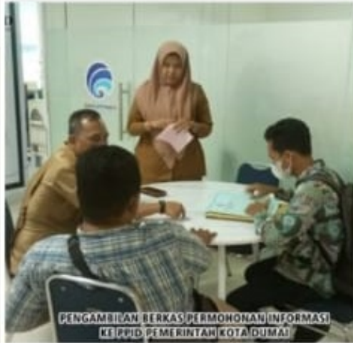
PENGAMBILAN BERKAS PERMOHONAN INFORMASI KE PPID, PEMERINTAH KOTA DUMAI