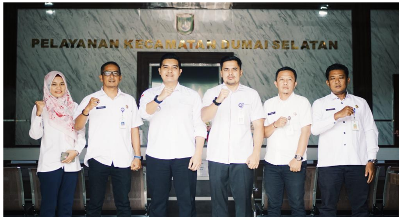
Sosialisasi Pengelolaan SP4N Lapor ke Kecamatan Dumai Selatan Kota Dumai, Tahun 2023