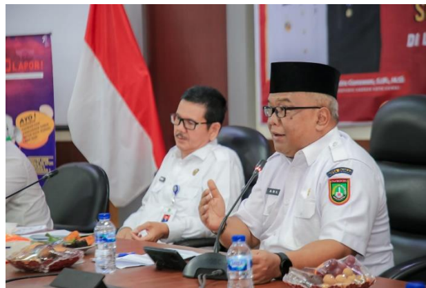
Focus Group Discussion, Penguatan Administrator Penghubung SP4N Lapor Perangkat Daerah