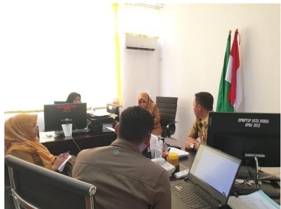
Pendampingan Admin SP4N Lapor ke Dinas Kependudukan dan Pencatatan Sipil dan DPMPTSP, Tahun 2023