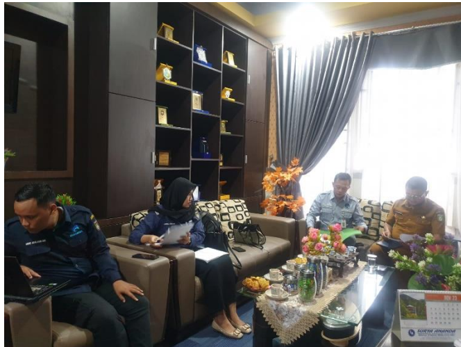
Pendampingan Admin SP4N Lapor ke Dinas Pendidikan dan Kebudayaan, Tahun 2023