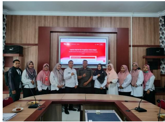
Sosialisasi Pengelolaan SP4N Lapor ke Dinas Kesehatan dan Puskesmas Kota Dumai, Tahun 2023.