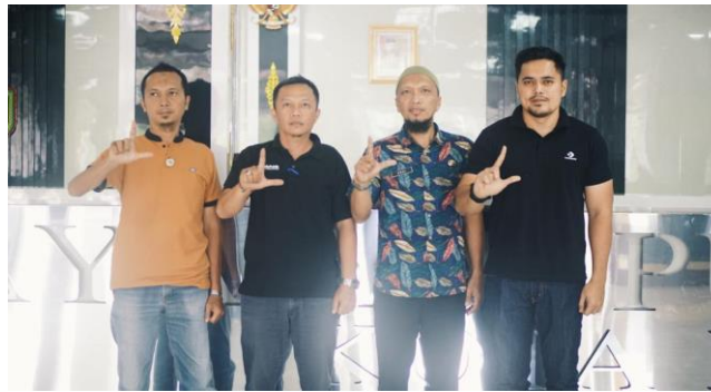
Sosialisasi Pengelolaan SP4N Lapor ke DPMPTSP Kota Dumai, Tahun 2023