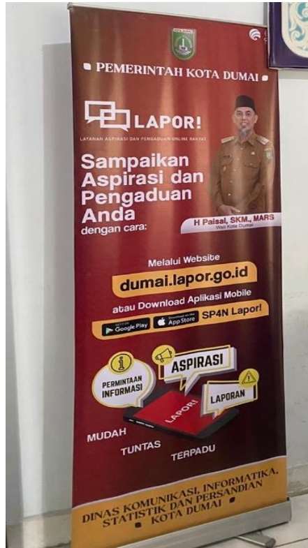
•Foto Deks Layanan SP4N Lapor